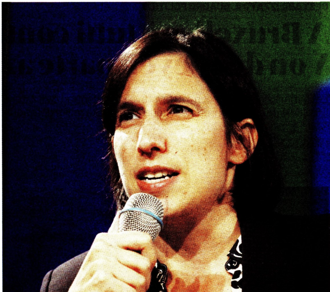
Elly Schlein oggi riunisce la direzione del Pd sul voto delle ultime elezioni regionali e per lanciare le prossime mobilitazioni nazionali