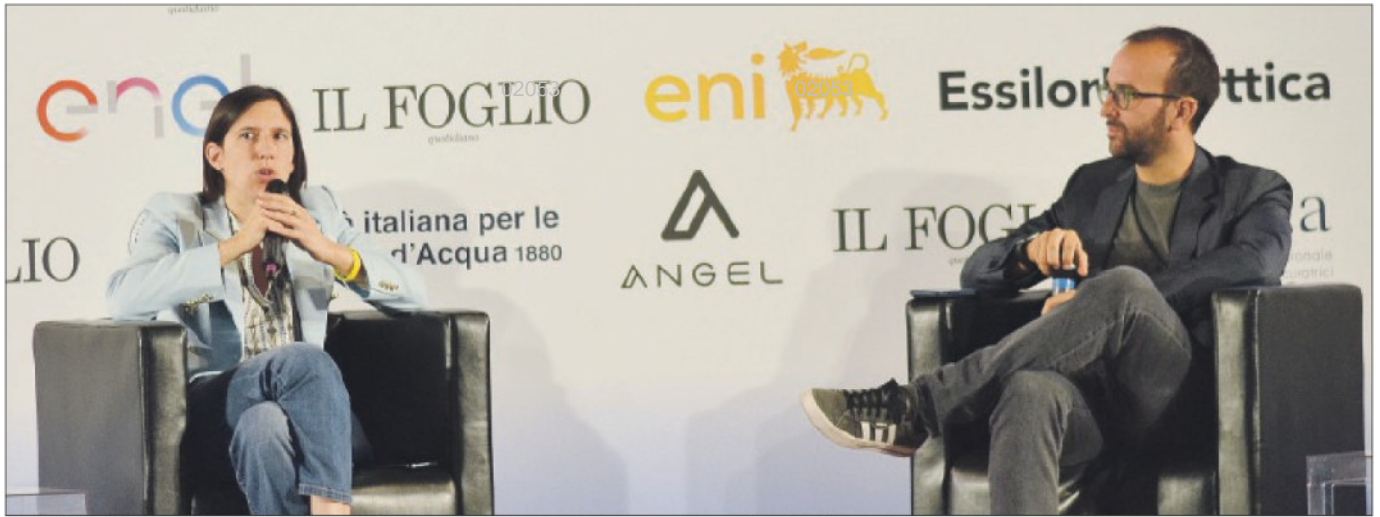
Elly Schlein e Claudio Cerasa sul palco della Festa dell'ottimismo del Foglio, sabato scorso a Firenze