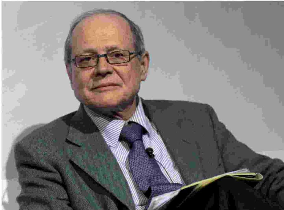
IL PRESIDENTE DEL CNEL. Tiziano Treu